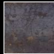
Ferroker export (Fondo Mar)

En este tipo de productos, SAURA S.L. se reserva el derecho a cambiar el tipo de revestimiento cerámico cuando lo crea conveniente, manteniendo la misma calidad que se oferta en catálogo.